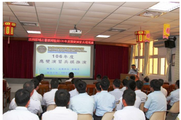
應變演習兵棋推演(二)