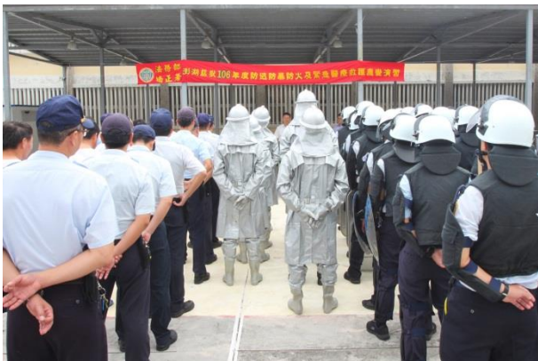
106 年度戒護安全應變演習(一)