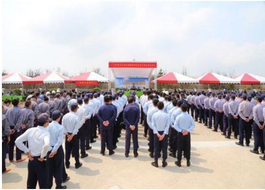
重大事故應變演習列隊集合(一)