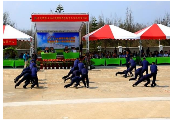
八極拳及綜合逮捕術(二)