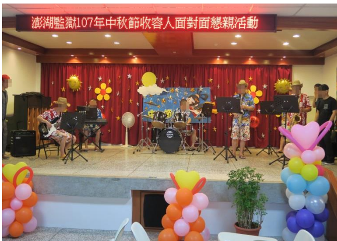
澎鼎管弦樂隊表演