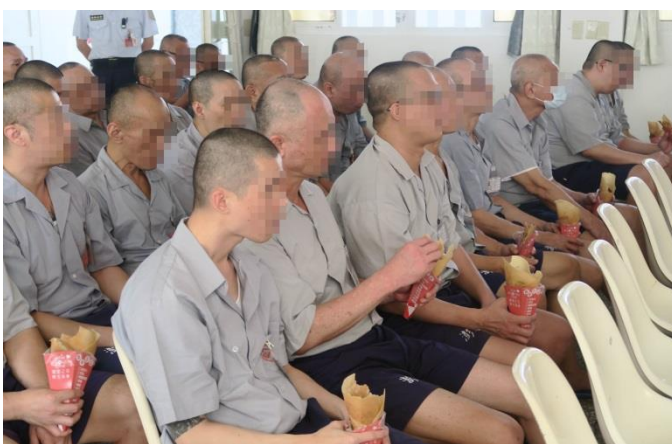
收容人歡喜享用可麗餅