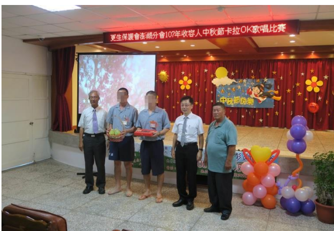
莊檢察長、紀典獄長、呂主委 致贈儀式合影