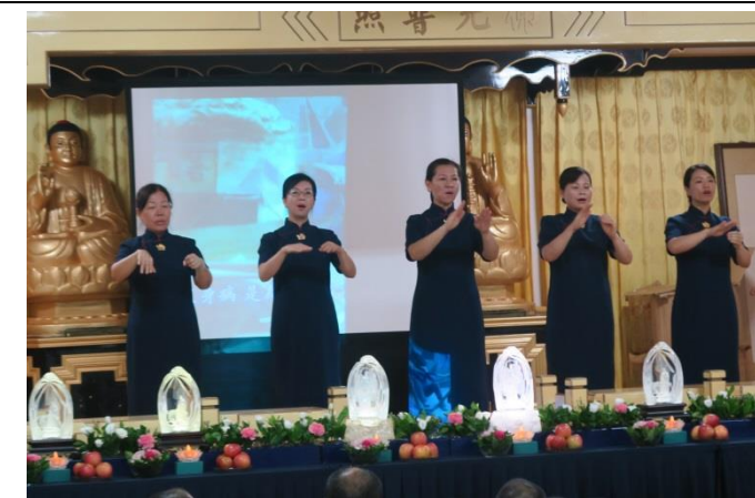
手語「跪羊圖」溫馨感人