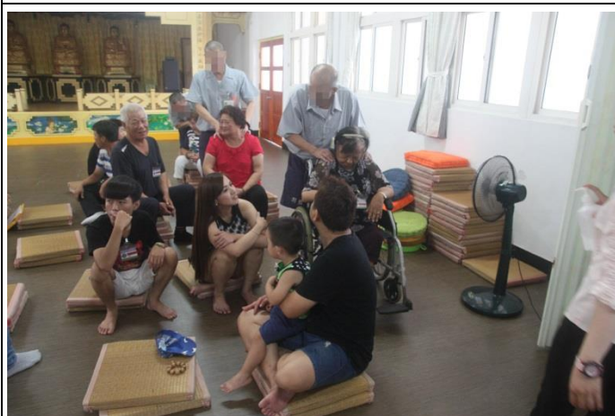
收容人與家屬相見歡