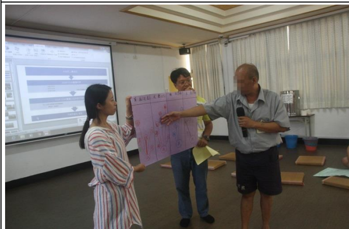
收容人勇敢說出引咎自責的過往(二)