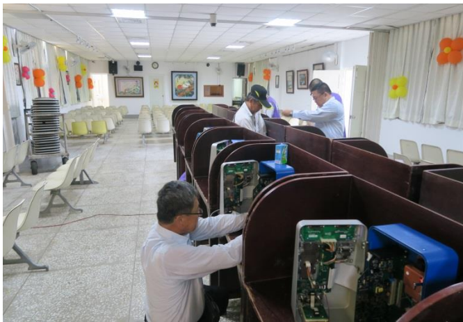
中華電信公司工作人員辛勞負出