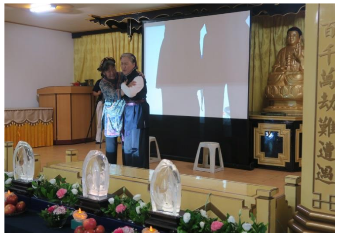
短劇「咬指痛心」感人肺腑