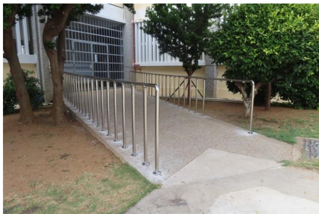
運動場無障礙設施(三)