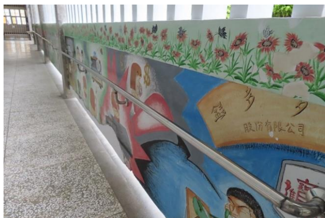
牆壁彩繪及扶手建置(二)