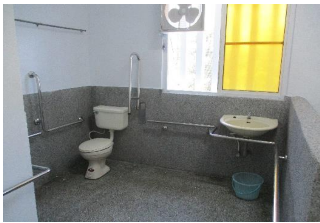
病舍無障礙空間(一)