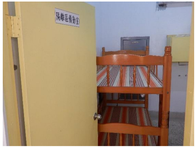
隔離專區備勤室(二)