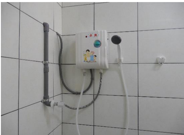
防疫備勤室熱水器(三)