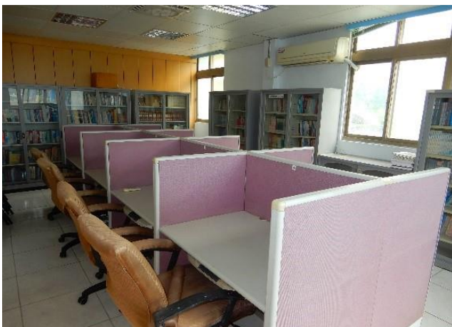
文康中心閱讀室(五)