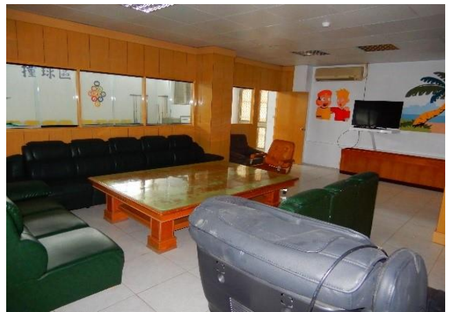
文康中心交誼廳(四)