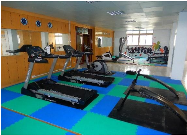
文康中心健身區(三)