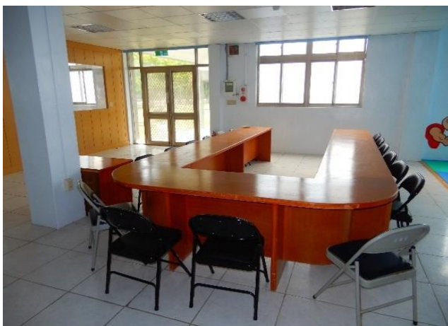
文康中心會議室(七)