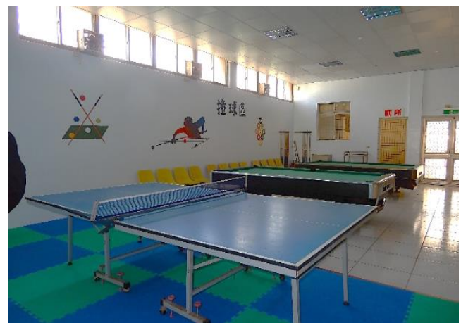
文康中心撞球區(六)