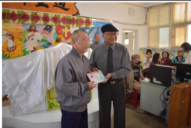
收容人歡欣領取浸禮證書