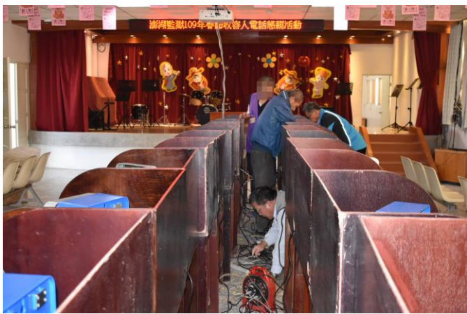
中華電信公司工作人員施工情形