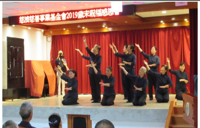
經藏演譯-智慧如海