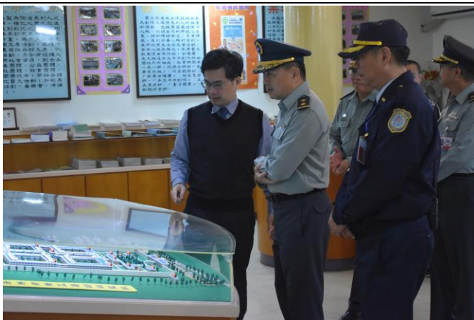
吳副典獄長向呂指揮官解說全監配置圖