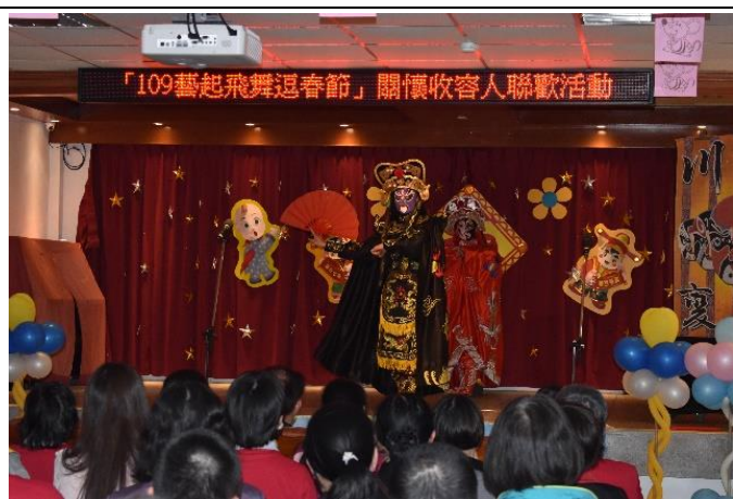
川劇變臉瞬間變化令人激賞