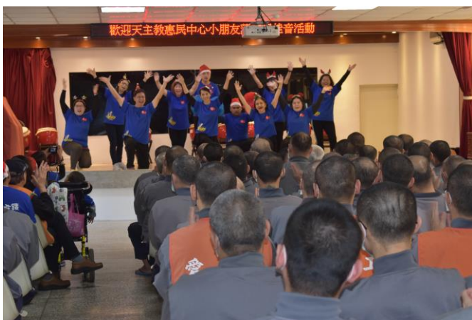
惠民志工老師精采演出