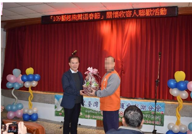
林典獄長明達感謝各界關懷