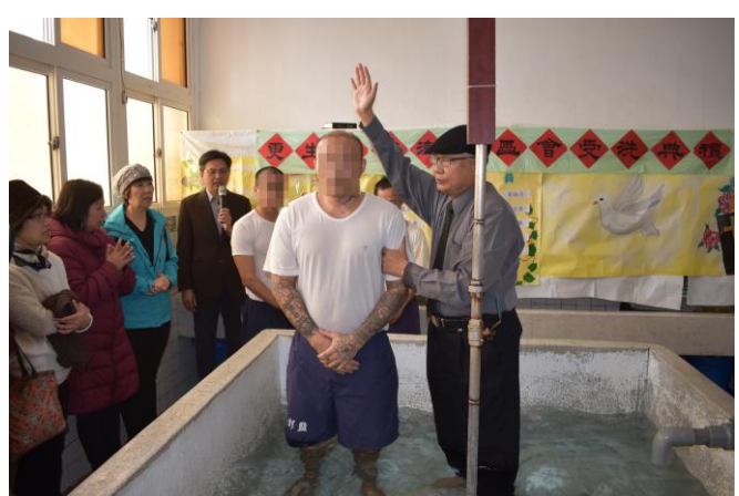
吳牧師為收容人舉行受浸儀式