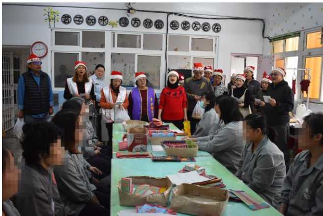
帶領收容人歡唱聖誕歌曲