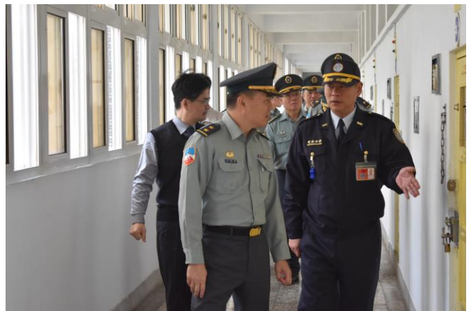
戒護科長向呂指揮官解說舍房措施