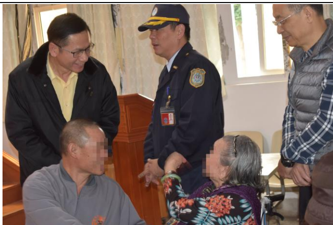
林典獄長親到會場關懷