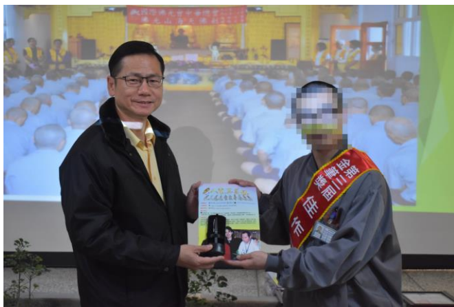
林典獄長頒發金筆獎獎項