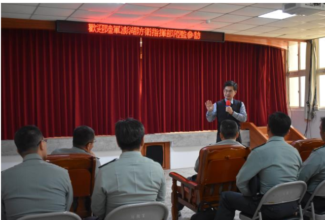
吳副典獄長向各級軍官解說管教措施