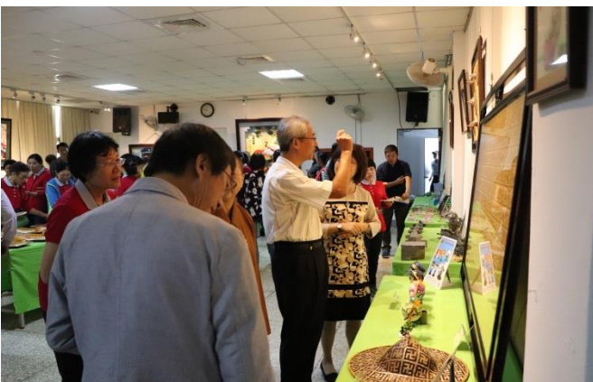
典獄長向來賓解說技訓成果