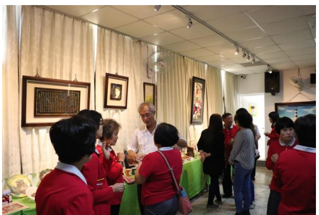
典獄長向來賓解說技訓成果