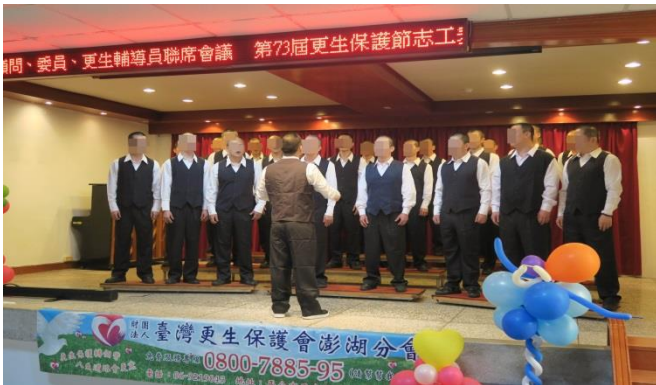
澎鼎合唱團精采演出

展示活動由本監深耕多年的澎鼎合唱團揭開序幕，悠揚的歌聲詮譯雋永經典曲目「今年夏天」和「恰似你的溫柔」，令與會來賓驚嘆連連並報以熱烈掌聲；緊接著，藉由品嚐手沖咖啡和各式甜點之餘，紀典獄長化身解說員，向外賓介紹各項技訓產品；此次活動不僅展現更生保護的重要性，也讓大家看見本監技訓的各項成果。