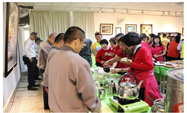
來賓品嚐現煮咖啡、甜點及欣賞技訓產品